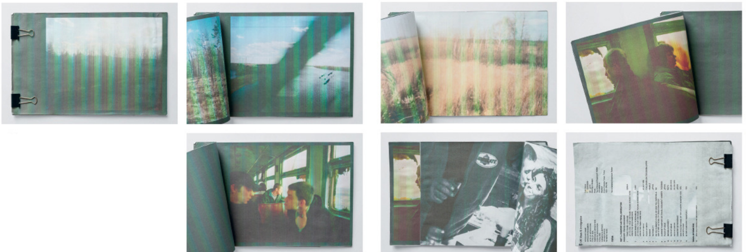
Untitled, 28.7 x 19 cm, Dummy by Kazuma Obara

Le photographe japonais a publié « 30 » en 2016. L'édition de 86 exemplaires, faite main, contient les trois titres « Exposure », « Everlasting » et « Newspaper ».