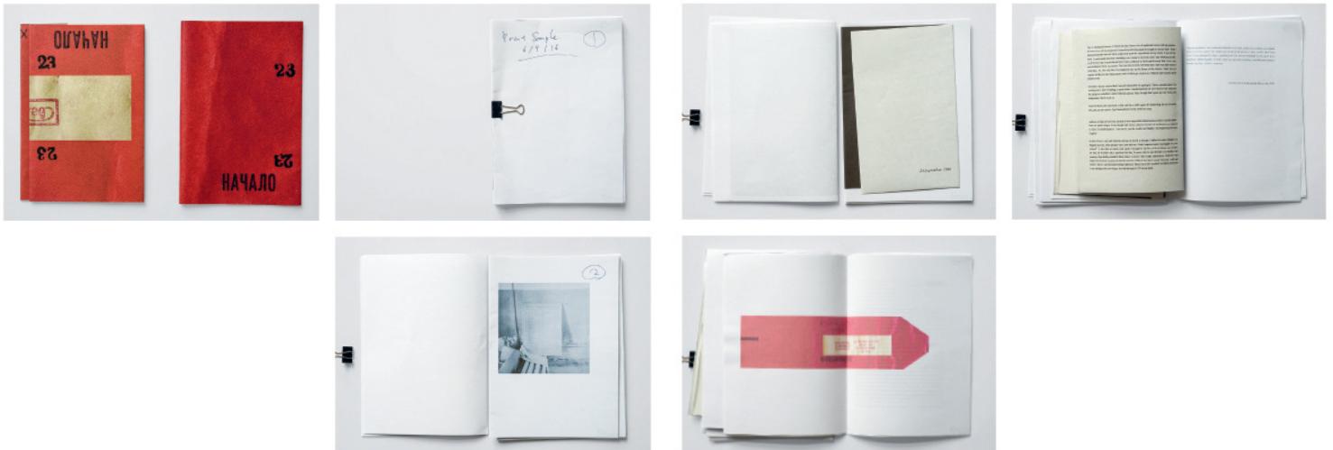
exposure, 14.8 x 21 cm, Dummy by Kazuma Obara

Portfolio avec 8 à 12 images consécutives (séquence) d'un reportage ou d'une série