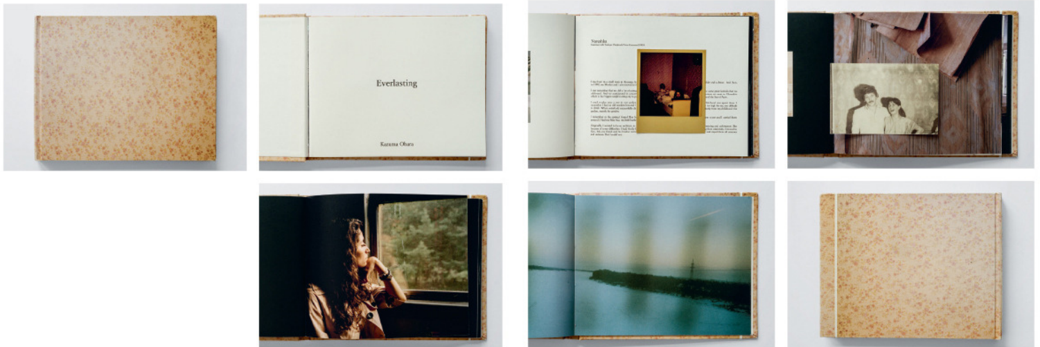
Everlasting, 23.8 x 19 cm, Dummy by Kazuma Obara